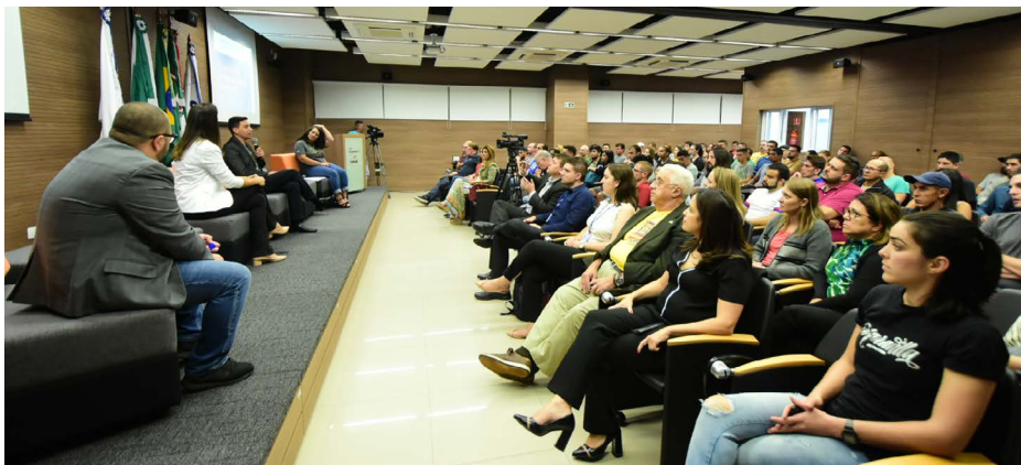
Evento aconteceu na Faculdade Senac Curitiba Portão e foi transmitido para todas as unidades do estado