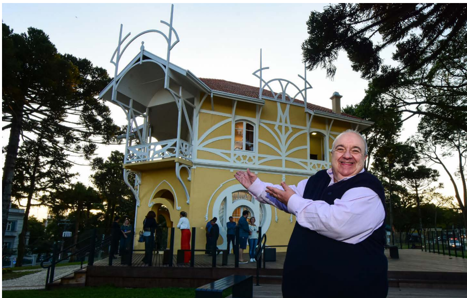
Prefeito Rafael Greca em frente ao Belvedere

Durante a reunião, Greca e seus convidados puderam conhecer o novo cardápio do Café-escola do Senac PR em homenagem à gastronomia paranaense.