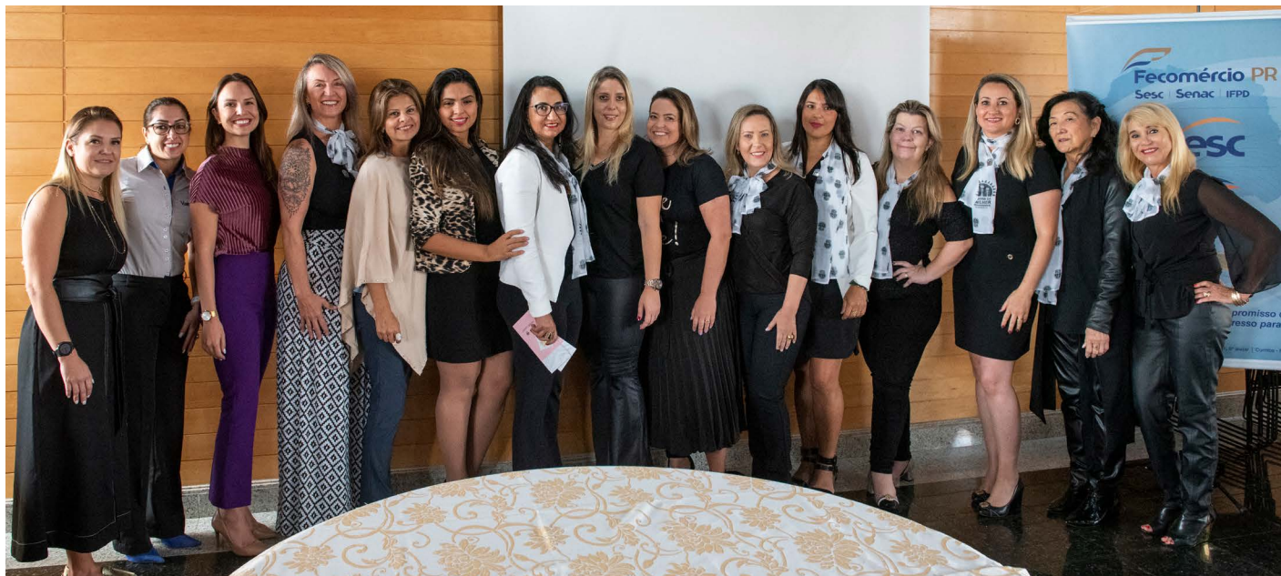
Diretoria da CMEG Curitiba

A Câmara da Mulher Empreendedora e Gestora de Negócios de Curitiba (CMEG) promoveu um café da manhã, junto com Rodada de Negócios, na sede da Fecomércio PR, na manhã de sexta-feira (6).