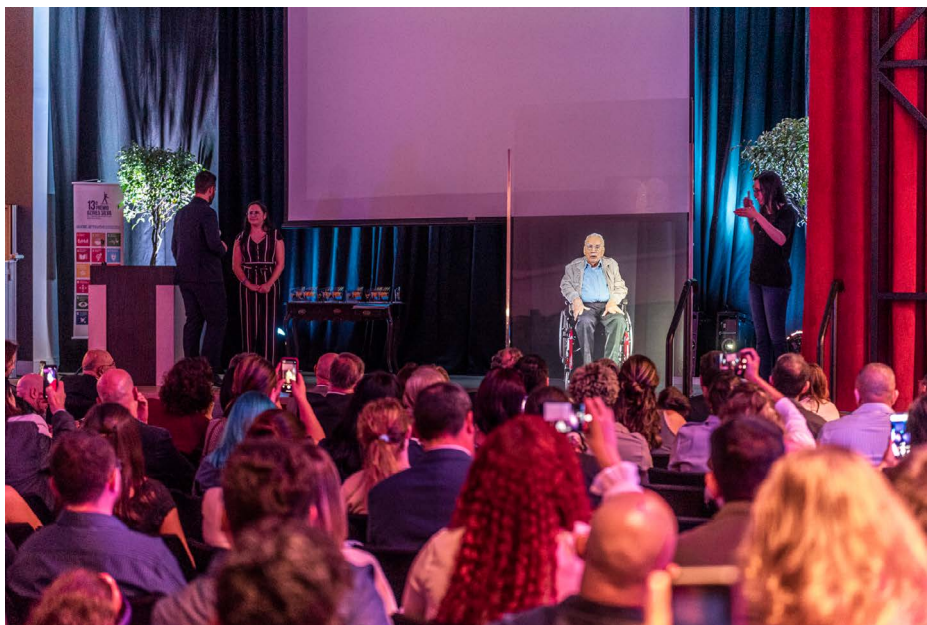
Ozires Silva, tema do evento e nome da premiação, em discurso por meio de imagem holográfica

Foi presidente da Embraer, da Petrobrás e da Varig, Ministro da Infraestrutura, patrono de diversos cursos de graduação pelo país. E conselheiro de uma série de conselhos e de associações de classe e condecorado em todo o mundo. Autor de cinco livros, teve sua vida contada por Decio Fischetti, na obra Um Líder da Inovação – Biografia do Criador da Embraer.