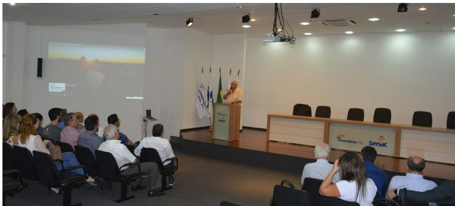
Visita à unidade do Senac Cascavel

Na sequência o grupo de representantes do Sistema Comércio realizou uma visita técnica à unidade