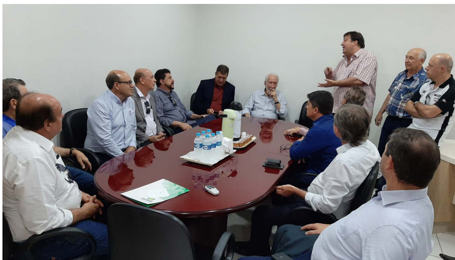
Visita à sede dos sindicatos empresariais de Cascavel filiados à Fecomércio PR

do Senac em Cascavel e também à sede dos sindicatos locais filiados à Fecomércio PR – Sindilojas Cascavel