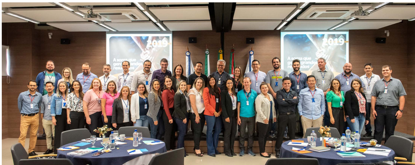
Participantes do Encontro anual do Técnicos de Relações com o Mercado (TRMs), na Faculdade Senac Portão

O Senac PR iniciou ontem (4) o Encontro anual do Técnicos de Relações com o Mercado (TRMs), com foco na integração das áreas dentro da instituição. O evento está sendo realizado em Curitiba, na Faculdade Senac Portão, e reuniu todos os TRMs do estado.