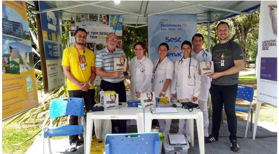
Representantes do Sesc e Senac Rio Negro recebem o vice-prefeito de Rio Negro, James Karson Valério, na ação de combate à dengue

Os materiais impressos da campanha e a programação da Unidade foram distribuídos nos comércios do local.