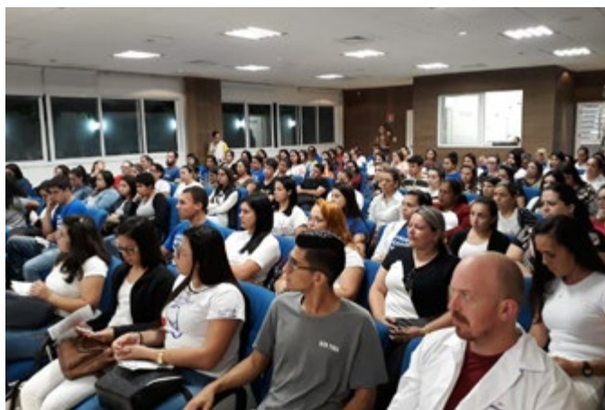
Alunos do Curso de Enfermagem assistem à palestra no Senac Paranaguá