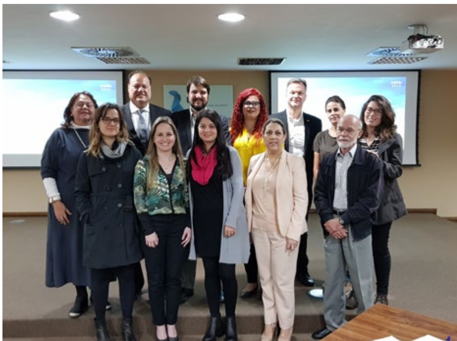
Representantes do Comitê Gestor do Curitiba 2035 se reúnem no Instituto Lactec

O Projeto Curitiba 2035 é uma iniciativa da sociedade civil organizada para a construção de diretrizes de longo prazo, que nortearão as políticas de desenvolvimento da cidade nos próximos 20 anos. O objetivo é posicionar Curitiba nas principais cidades inovadoras do mundo. Foram definidas nove comitês temáticos: Governança; Planejamento e Gestão Urbana; Segurança; Cidade da Educação e do Conhecimento; Desenvolvimento Socioeconômico; Mobilidade e Transporte; Meio Ambiente e Biodiversidade; Saúde e Qualidade de Vida; e Coexistência em uma Cidade Global. A Fecomércio PR participa ativamente do programa, como mem-